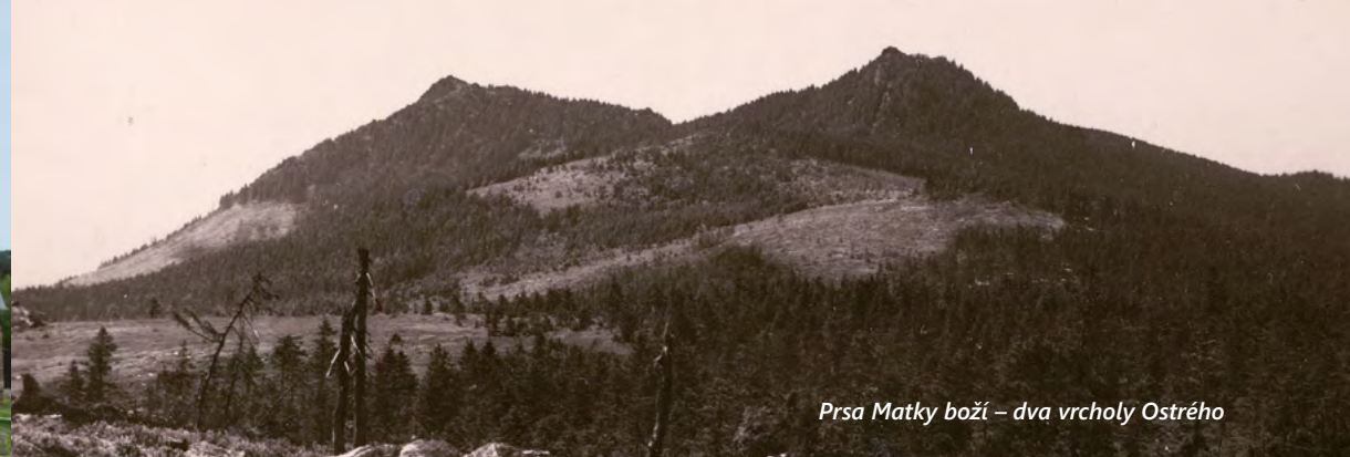
Prsa Matky boží – dva vrcholy Ostrého